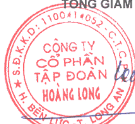
PHẠM PHÚC TOẠI